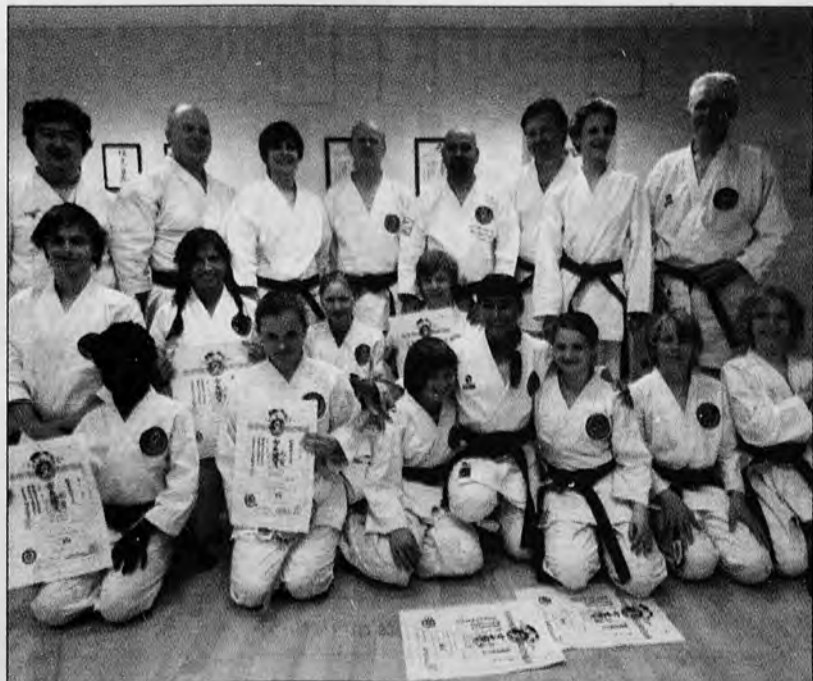
FIKK NYE BELTER: Mange av Narvik karateklubbs medlemmer fikk nytt belte før sommeren etter forrige ukes gradering.

TOMMY JENSEN tommyje@fremover.no Tlf 76 95 00 00